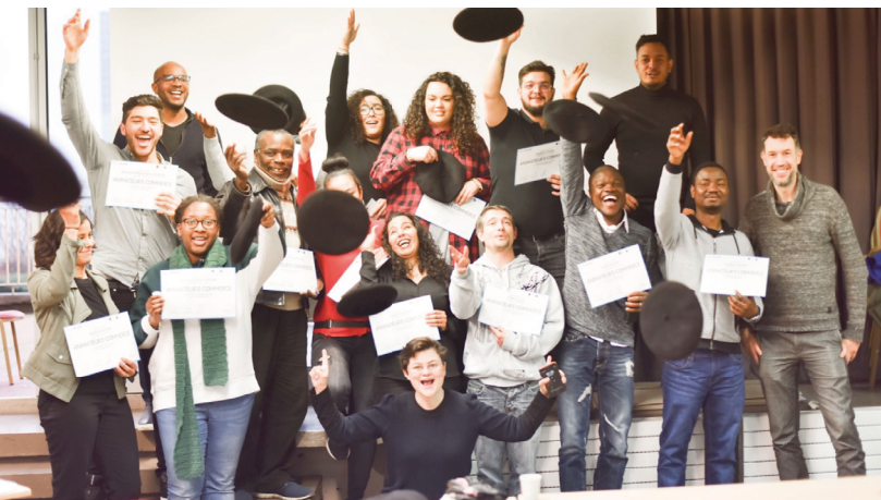
Remise des diplômes pour la 1ère promotion Chef de Projet e-commerce

Grâce au soutien de la Grande École du Numérique et de la Fondation de France , Label École a formé en 2019, une première promotion de 16 apprenants, 8 femmes et 8 hommes, tous éloignés de l'emploi, et poursuit l'aventure en 2020 avec 110 apprenants, grâce au soutien du Plan Investissement Compétences, de la Région IDF, des fonds européens, de la fondation Link Together , et l'appui de très nombreuses entreprises en mécénat de compétences.