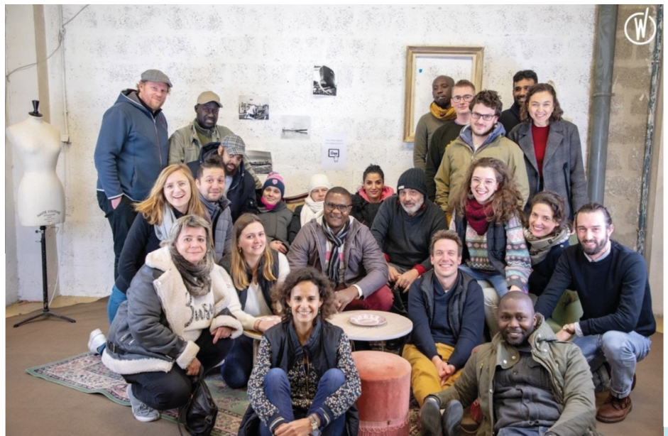
L'équipe Label Emmaüs

A suivre et rdv le 18 mai pour 3 mois de formation Chef de projet e-commerce !