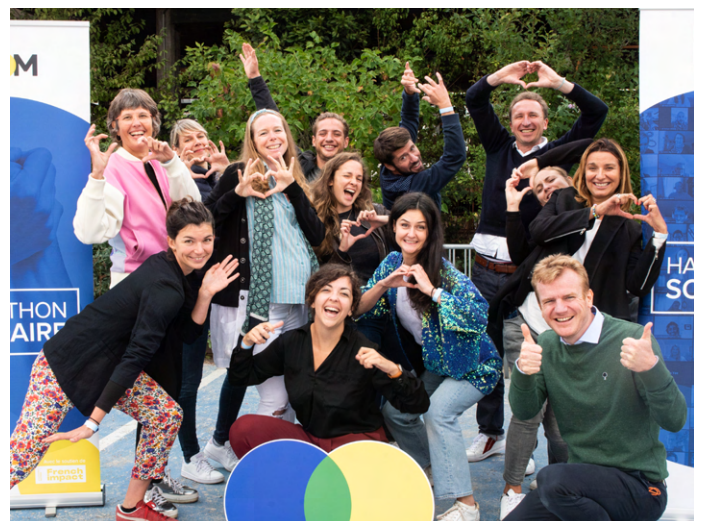
L'équipe du Groupe La Poste qui a remporté le Hackathon solidaire Big Bloom en septembre dernier

En effet, une véritable chaîne de solidarité se construit pour l'occasion auprès des 250 000 collaborateurs postiers. Un défi intitulé "tous postiers, tous donateurs" ! L'objectif du défi : 10 000 objets donnés en un mois par les salariés de La Poste ! Un challenge en équipe qui sera complété par une communication auprès des particuliers à travers les réseaux sociaux des postiers.